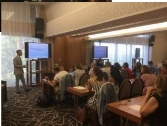
„Zmeny zákona o verejnom obstarávaní v roku 2022 a ich dopady“, 27. 06. 2022, účelové zariadenie ÚV SR Hotel Bôrik, Bratislava