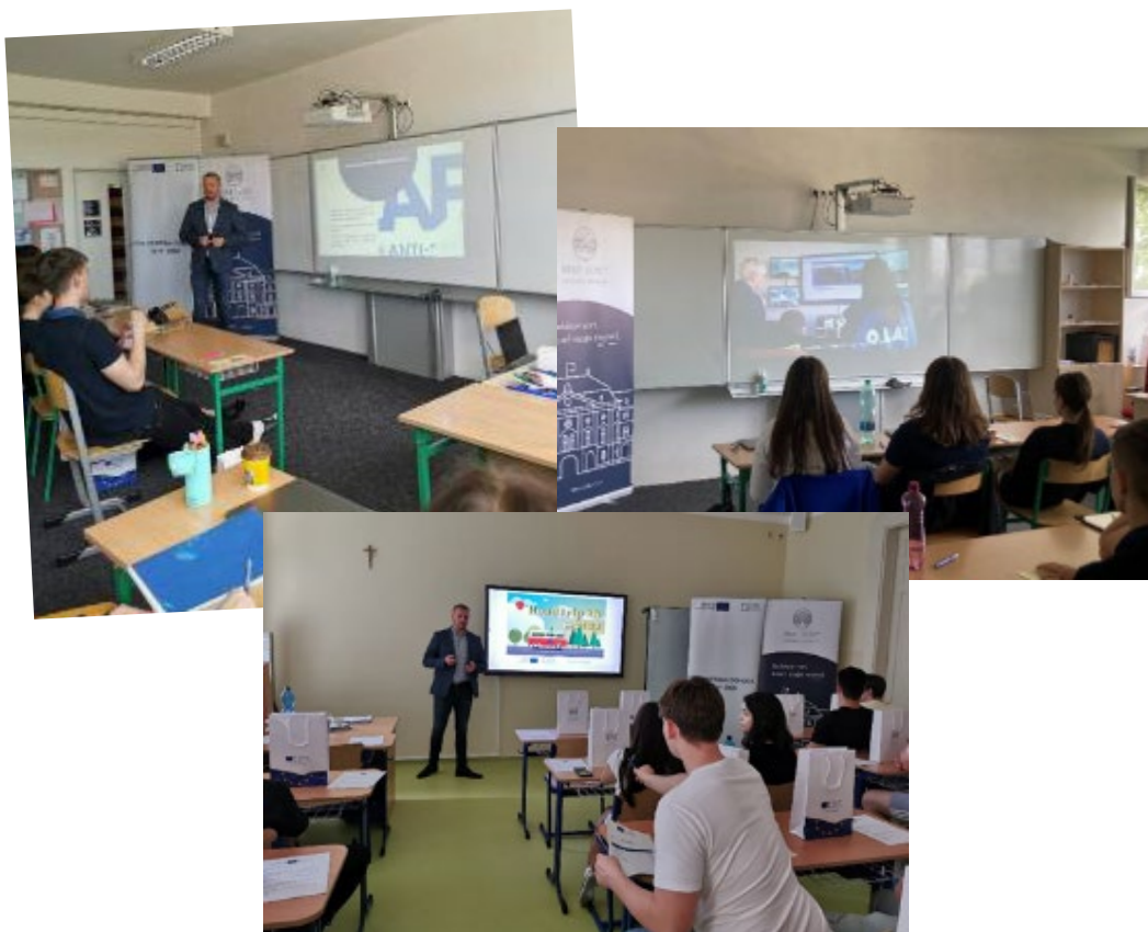
Prednáška na Súkromnom bilingválnom gymnáziu BESST a na Arcibiskupskom gymnáziu biskupa P. Jantauscha v Trnave, 03. jún 2022