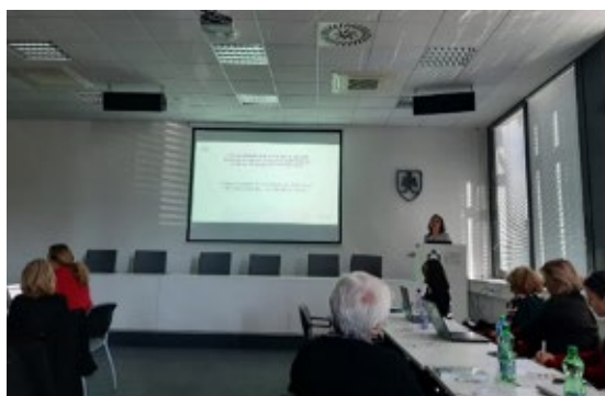
Vedecký park UK, Ilkovičova 8, Bratislava

Dňa 23. septembra 2022 prezentovala zamestnankyňa ONÚ OLAF na Diskusnom fóre: Vzdelávanie v oblasti finančnej gramotnosti v kocke tému OFZ EÚ a boj proti podvodom, ktorá je súčasťou výučby prierezovej témy Finančná gramotnosť na školách už od roku 2014. Organizátorom podujatia bol Štátny inštitút odborného vzdelávania, odbor Finančnej gramotnosti a Slovenského centra cvičných firiem a Úsek celoživotného vzdelávania. Partnerom podujatia bola Sektorová rada pre bankovníctvo, finančné služby, poisťovníctvo. V príspevku boli prezentované úlohy ONÚ OLAF a OLAF-u, ako aj vysvetlené základné pojmy, ktoré súvisia s témou OFZ EÚ a boja proti podvodom. Na praktickom príklade boli vysvetlené fázy protipodvodného cyklu. V príspevku boli uvedené trestné činy, ktoré sa týkajú poškodzovania finančných záujmov EÚ. V závere príspevku bol vysvetlený spôsob nahlasovania podozrení z nezrovnalostí a podvodov pri čerpaní prostriedkov EÚ. Viac informácií sa nachádza v tlačovej správe ONÚ OLAF zo dňa 28. 09. 2022.