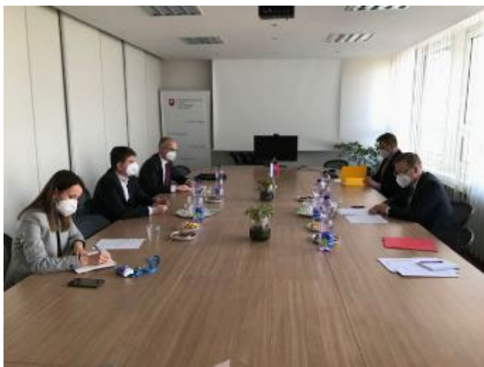
Predstavitelia PMÚ SR a ÚOHS počas pracovnej návštevy, 02. 02. 2022, Bratislava

V rámci ďalšieho rozvíjania bilaterálnej spolupráce s partnerským úradom na ochranu hospodárskej súťaže v Českej republike (ďalej len „ÚOHS“) predstavitelia PMÚ SR dňa 2. 2. 2022 privítali hostí z ÚOHS na pracovnej návšteve v Bratislave. Pre obe strany bola pracovná návšteva príležitosťou na podrobné prekonzultovanie viacerých aktuálnych výziev , ktorým v súčasnosti čelia obe inštitúcie a zároveň na zaujatie jednotného a čo najlepšieho postoja k riešeniu momentálnych otázok pri ochrane hospodárskej súťaže a presadzovaní jej princípov.