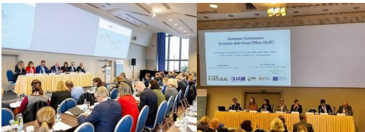
Konferencia EÚ: "Predchádzať - Odhaľovať - Vyšetřovať: Nové výzvy v boji proti podvodom a nezrovnalostiam vo výdavkovej oblasti", Praha, dňa 23. 11. 2022 - 25. 11. 2022