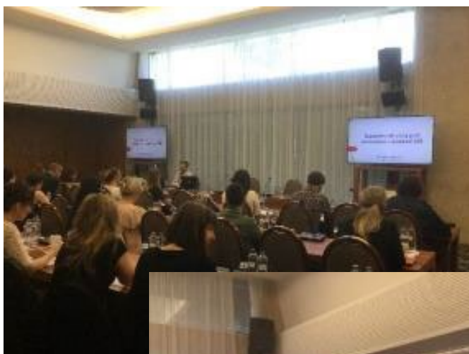
„Riadenie rizík a boj proti podvodom v prostredí EŠIF“, 12. 05. 2022, účelové zariadenie ÚV SR Hotel Bôrik, Bratislava