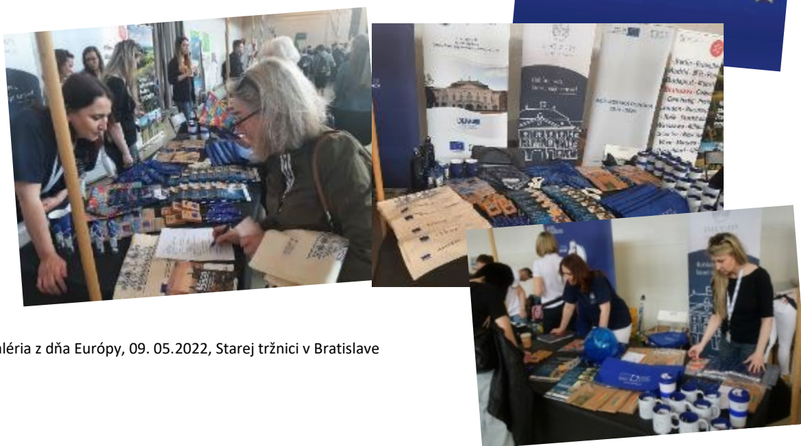
Fotogaléria z dňa Európy, 09. 05.2022, Starej tržnici v Bratislave